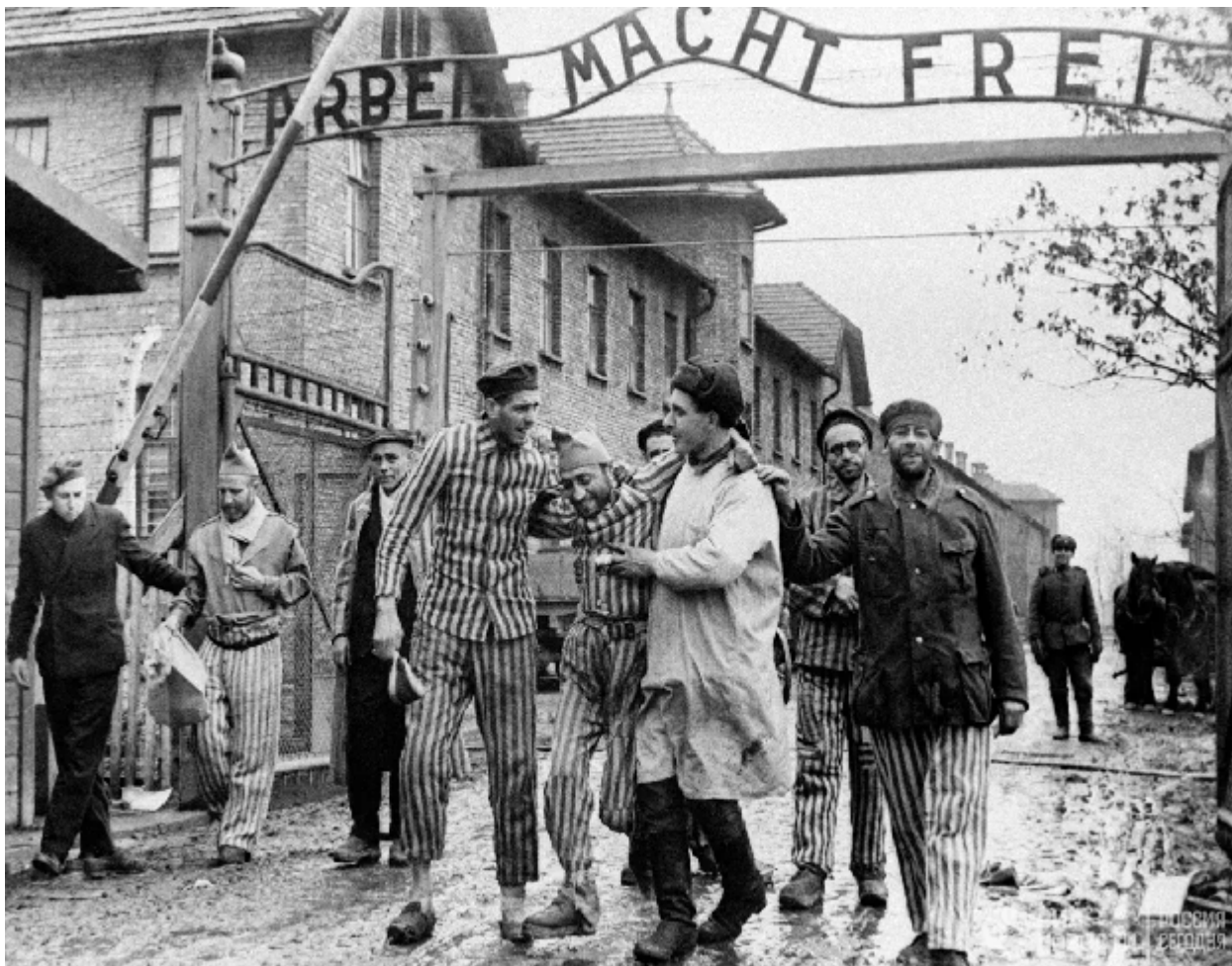
«Освобождение советскими войсками узников немецко-фашистского концлагеря "Аушвиц-Биркенау" - Освенцим»

последующие годы гитлеровская Германия на территории оккупированных ею европейских стран создала гигантскую сеть концентрационных лагерей, превращенных в места организованного систематического убийства миллионов людей.